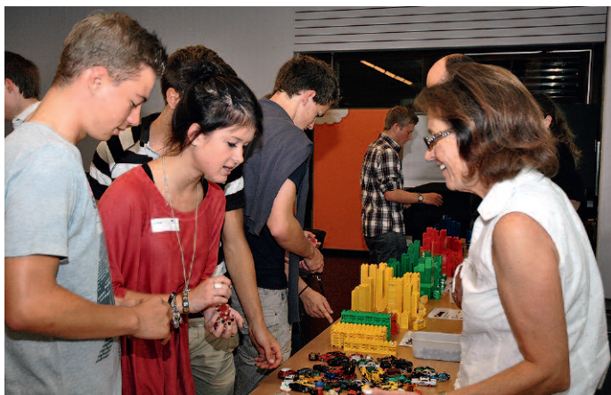
Beim «Immobilienmarkt» entstehen Kontakte zwischen Verwaltungsmitgliedern und Jungbürgern.